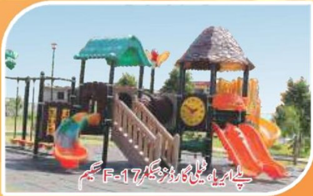
پلے ایریا، ٹیلی گارڈنز سکیم F-17

سکیم کی سڑکوں کی صفائی کے علاوہ ہر گھر کے سامنے سے کوڑا کرکٹ اٹھانے کا بندوبست کیا گیا ہے۔ اس کے علاوہ بہت سے گھروں کی تعمیر تیزی سے جاری ہے۔ نئے انٹرنیشنل ایئرپورٹ تک رسائی کے لئے میٹرو بس کے ٹریک بچھانے کا کام تیزی سے جاری ہے۔ نیو انٹرنیشنل ایئرپورٹ اور سی پیک سے متصل ہونے کی وجہ سے یہاں پلاٹوں کی خریداری دسترس سے باہر ہونے کا امکان ہے۔ اس سکیم کی تمام تر جدید سہولیات آپ کی منتظر ہیں۔