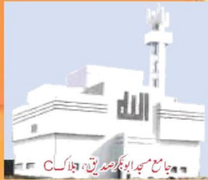
جامع مسجد ابو بکر صدیق، بلاک C