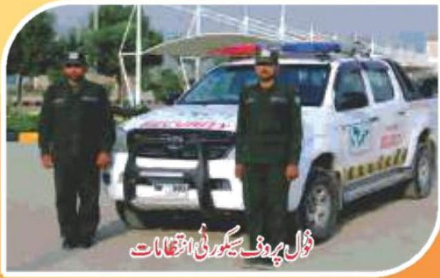
ڈال پروف سیکورٹی انتظامات