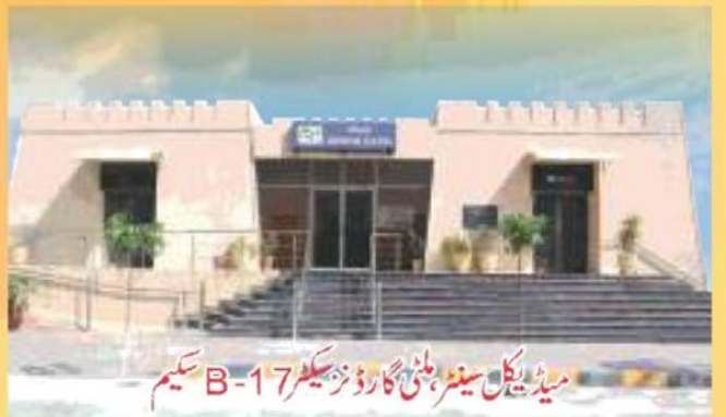
میڈیکل سینٹر، بلٹی گارڈنز سیکٹر B-17 سکیم