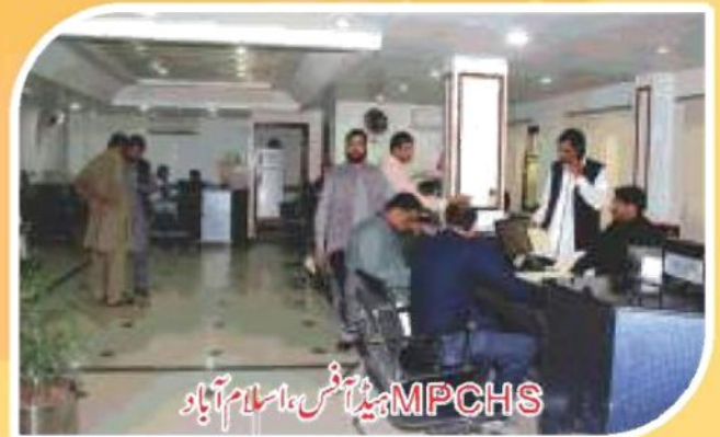
MPCHS میڈیا آفس، اسلام آباد