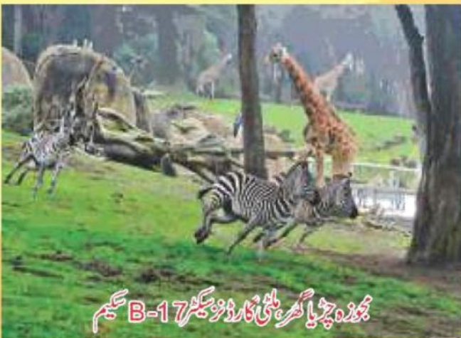
مجوزہ چڑیا گھر، ملٹی گارڈنز سیکٹر B-17 سکیم

سیکیم میں ممبران کی سہولت کے لئے 24 گھنٹے ایسوسی ایشن کی سہولت میسر ہے جبکہ وزٹ کے لئے آنے والے معزز مہمانوں کے لئے سفاری وین سروس بھی جاری ہے۔ بلاک A, B سے ملحقہ گرین بیلٹ میں تفریحی سرگرمیوں کیلئے جگہ مختص کی گئی ہے۔ اس پوری بیلٹ میں فٹبال اور کرکٹ گراؤنڈ کے علاوہ، منی گالف کورس، چڑیا گھر، پارک، ریسٹورانٹ، ٹینس کلب اور بے شمار تفریحی سرگرمیوں کی گنجائش رکھی گئی ہے۔ کرکٹ گراؤنڈ اور فٹ بال گراؤنڈ مکمل تیار ہو گئے ہیں جہاں پر کھیلوں کے کئی مقابلے ہو چکے ہیں، چڑیا گھر کی تعمیر کیلئے دو پارٹیوں سے بات چیت چل رہی ہے بہت جلد اس سیکم میں چڑیا گھر کی تعمیر کا آغاز ہونے والا ہے۔ سیکم میں ایک جدید طرز کی منفرد مارکی تعمیر کی جا رہی ہے جس کی وجہ سے یہاں کی رونق میں مزید اضافہ ہوگا۔