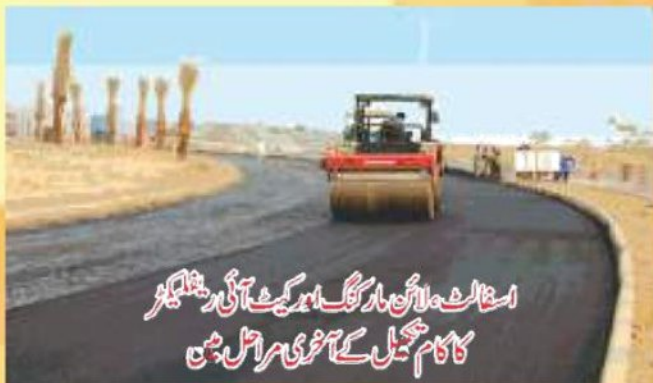
اسٹاف لائن مارنگ اور گٹ آئی ریٹائلنگز کا کام جھیل کے آخری مراحل میں

سکیم کے کچھ علاقے میں زمین کے حصول میں دشواری کا سامنا رہا۔ انتظامیہ کی بھرپور کوششوں سے اب صورت حال بہت بہتر ہو گئی ہے۔ بلاک D اور بلاک C کا کافی علاقہ اب حاصل کیا جا چکا ہے۔ وہ ممبران جو جلد گھر بنانا چاہتے تھے جیسا کہ پچھلی AGM میں اعلان کیا گیا تھا انہیں متبادل پلاٹ دے دیئے گئے ہیں۔ مستقبل قریب میں باقی پلاٹوں کے قبضوں کا حصول سوسائٹی کے لئے ممکن ہو سکے گا۔ سکیم میں 600 سے 700 خاندان رہائش پذیر ہیں جبکہ 1150 سے زائد گھروں کی تعمیر کا کام تیزی سے جاری ہے۔ غرضیکہ سکیم اپنی نوعیت کا ایک منفرد رہائشی منصوبہ ہے جو آپ لوگوں کی رہائش کا منتظر ہے۔