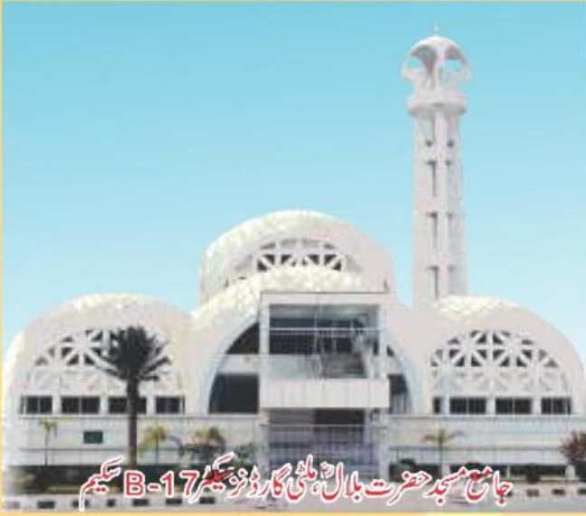
جامع مسجد حضرت بلال ملٹی گارڈنز سیکٹر B-17 سکیم

سیکیم میں ممبران کی سہولت کے لئے 24 گھنٹے ایسوسی ایشن کی سہولت میسر ہے جبکہ وزٹ کے لئے آنے والے معزز مہمانوں کے لئے سفاری وین سروس بھی جاری ہے۔ بلاک A, B سے ملحقہ گرین بیلٹ میں تفریحی سرگرمیوں کیلئے جگہ مختص کی گئی ہے۔ اس پوری بیلٹ میں فٹبال اور کرکٹ گراؤنڈ کے علاوہ، منی گالف کورس، چڑیا گھر، پارک، ریسٹورانٹ، ٹینس کلب اور بے شمار تفریحی سرگرمیوں کی گنجائش رکھی گئی ہے۔ کرکٹ گراؤنڈ اور فٹ بال گراؤنڈ مکمل تیار ہو گئے ہیں جہاں پر کھیلوں کے کئی مقابلے ہو چکے ہیں، چڑیا گھر کی تعمیر کیلئے دو پارٹیوں سے بات چیت چل رہی ہے بہت جلد اس سیکم میں چڑیا گھر کی تعمیر کا آغاز ہونے والا ہے۔ سیکم میں ایک جدید طرز کی منفرد مارکی تعمیر کی جا رہی ہے جس کی وجہ سے یہاں کی رونق میں مزید اضافہ ہوگا۔