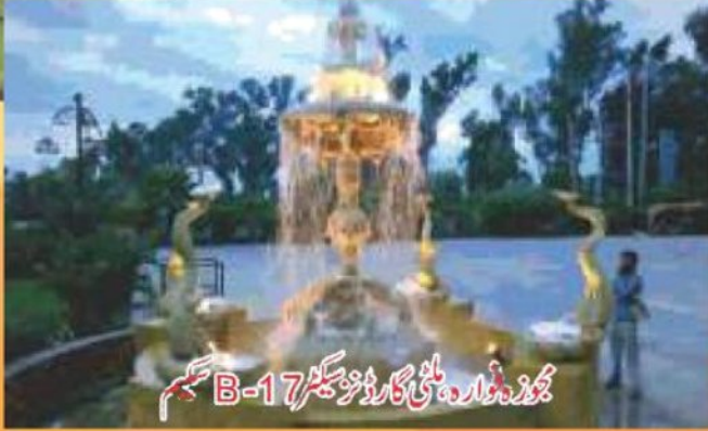
مجوزہ دارہ بلٹی گارڈنز سیکٹر B-17 سکیم

بلاک B میں سکیم کی خوبصورتی کے لئے فوارے لگائے گئے ہیں اور ایک مونیومنٹ کی تعمیر آئندہ ماہ کے آخر تک مکمل ہو جائے گی۔ جبکہ ملٹی کلب کی تزئین و آرائش کا کام آخری مراحل میں ہے۔ انشاء اللہ یہ بھی بہت جلد اپنا کام شروع کر دے گا۔ سکیم کے اندر کشادہ سڑکوں کے ساتھ ساتھ جھیل اور پارک جگہ جگہ لوگوں کی دلچسپی کا باعث بن رہے ہیں۔ بلاک F میں کمرشل ایریا۔ جامع مسجد حضرت علیؑ اور ولاز کی تعمیر کا کام تیزی سے جاری ہے اور مزید ولاز کی تعمیر کیلئے تقریباً 300 سے زائد پلاٹ الاٹ کئے جا رہے ہیں۔ بلاک A سے بلاک E اور F تک 110 فٹ چوڑی مین شاہراہیں مکمل ہیں۔ جو آمد و رفت کیلئے کھول دی گئی ہیں۔ اس شاہراہ کی وجہ سے اب جی ٹی روڈ سے موٹروے تک کا فاصلہ چاروں بلاکوں کے درمیان سے ہوتا ہوا سگنل فری ٹریفک کے ہونے کی وجہ سے 5 سے 10 منٹ کا رہ گیا ہے۔ شاہراہ کے اطراف میں تمام علاقوں کو پوری سکیم کے ساتھ مربوط کر دیا گیا ہے۔