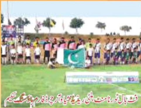
فٹ بال ٹورنامنٹ، ملٹی ریڈیٹشیا اور چرڈ فارم ہاؤسنگ سکیم

ملٹی ریڈیٹشیا اور چرڈ فارم ہاؤسنگ سکیم خوبصورتی میں یہ اپنی مثال آپ ہے۔ یہ سکیم ملک میں فارم ہاؤس جیسے منصوبوں کیلئے ایک مثالی نمونہ ہوگی۔ سونے پہ سہاگہ اس کا محل وقوع ہے جو جھنگ باہتر انٹر چینج کے ذریعے موٹروے سے متصل ہے۔