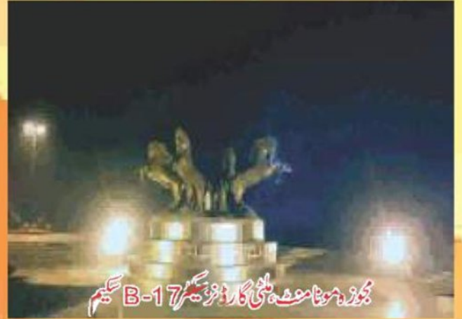
مجوزہ مونا مونت، ملٹی گارڈنز سیکٹر B-17 سکیم

سوسائٹی کا یہ سب سے بڑا منصوبہ ہے۔ یہ سیکم راولپنڈی سے پشاور جانے والی جی ٹی روڈ اور موٹر وے (M-1) دونوں کے درمیان ایک دوسرے سے منسلک ہے۔ مارگلہ پہاڑیوں کا دامن اس کی خوبصورتی کی علامت ہے۔ اس سیکم کو موٹر وے اور جی ٹی روڈ سے منسلک کرنے کیلئے سنگجانی انٹر چینج عوام الناس کیلئے کھول دیا گیا ہے۔ اس سیکم کا محل وقوع مستقبل میں انتہائی اہمیت کا حامل ہوگا۔